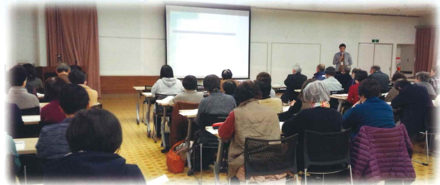
平成30年1月、北牧楽集館にて、「ボランティア講座」。

現在 16 団体、約 225 名の方が加入し活動しています。読み聞かせや紙芝居、子供達の見守りやサポート、傾聴や話し相手など多様な種類があります。